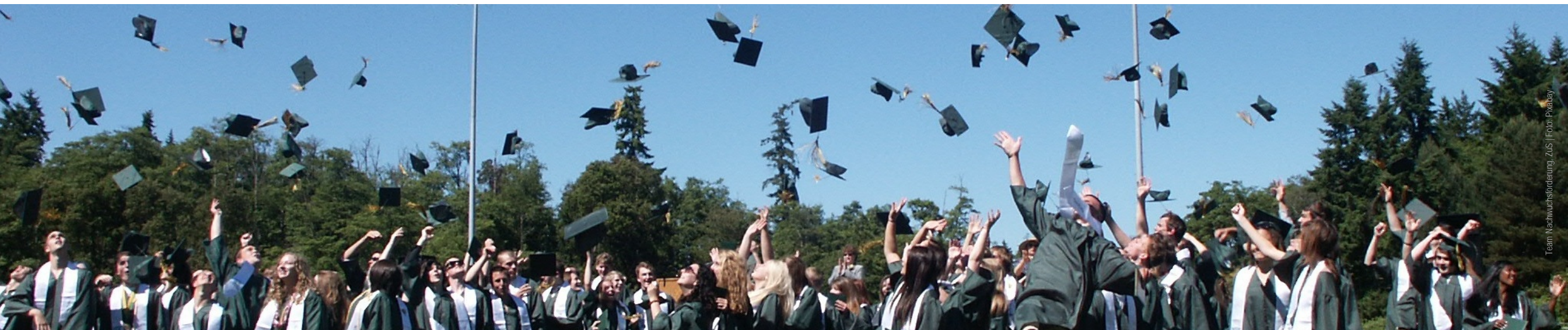
Team Nachwuchsförderung, ZuS